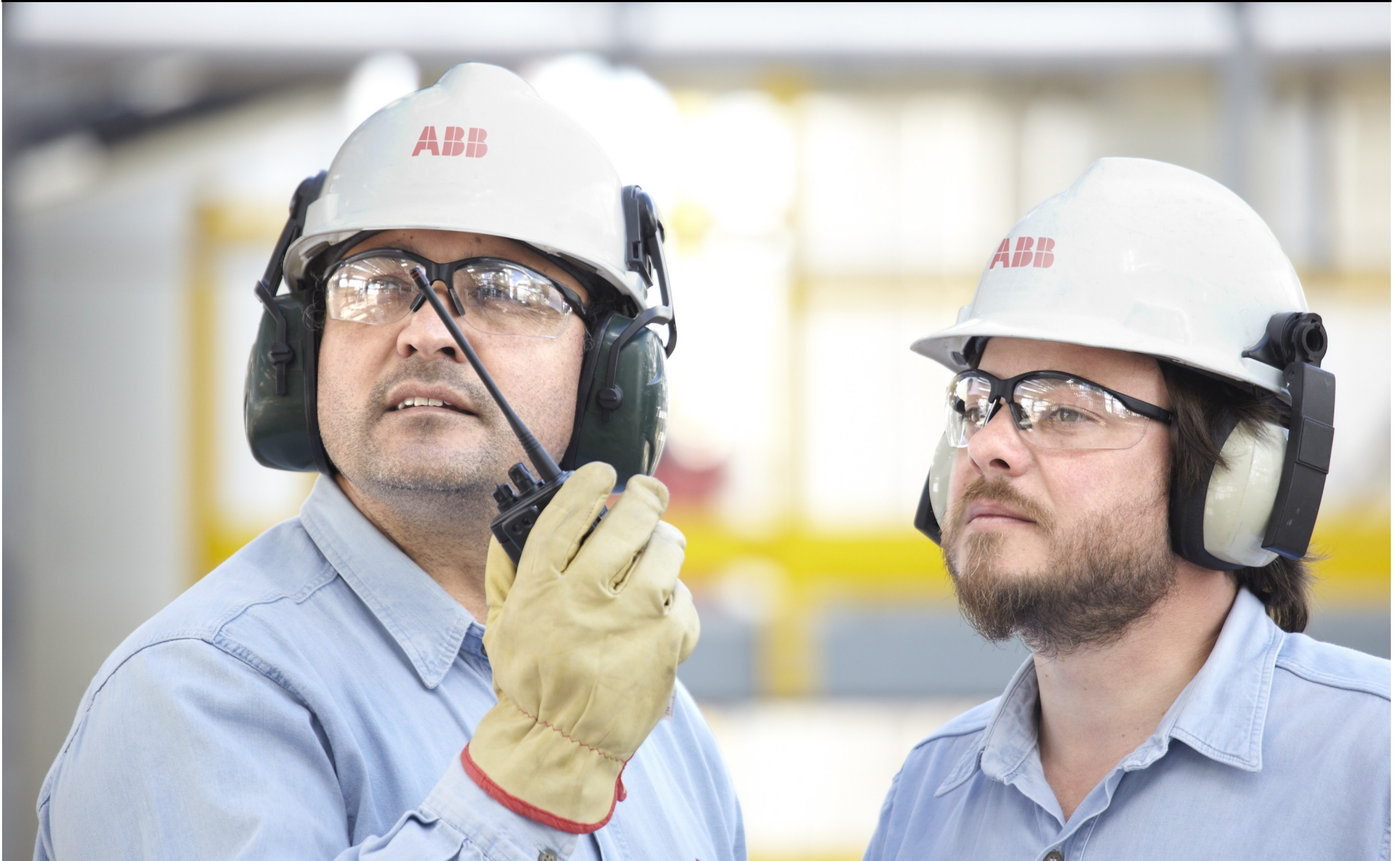
ABB líder en tecnologías de automatización y potencia, consciente de la responsabilidad que tiene con sus clientes, colaboradores, sociedad, estado, accionistas y demás partes interesadas, asume como un valor la seguridad y salud ocupacional de sus colaboradores así como la protección y el cuidado del ambiente, a través del cumplimiento de la normativa legal y de los siguientes lineamientos:

Centro América y el Caribe - Marzo 2015 - Revisión 2