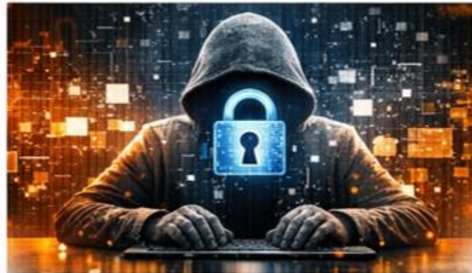
Risques de cyber-sécurité