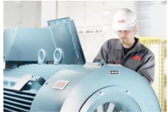
ABB als weltweite Technologieführerin in der Energie- und Automatisierungstechnik bietet Service