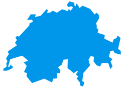
ABB-Service Umfassendes Portfolio an Dienstleistungen