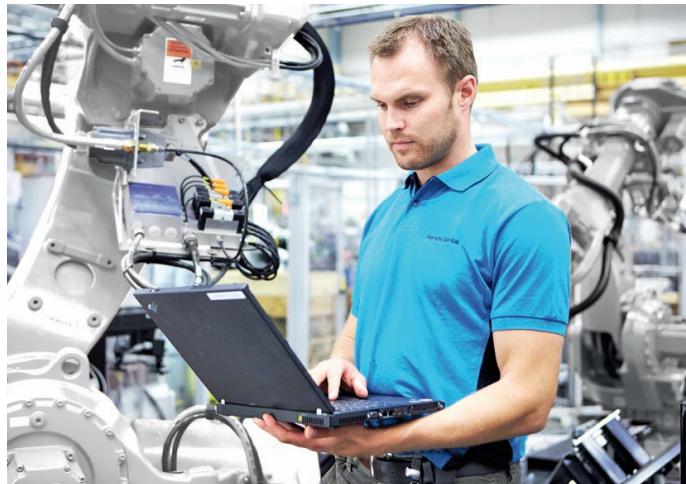
Kompetenter Service vor Ort oder via Fernzugriff

Höchstmögliche Verfügbarkeit der Anlagen, lange Lebensdauer der Roboter und Steuerungen sowie wenig Unterbrüche durch Servicearbeiten garantieren nachhaltigen Erfolg und Sicherheit. So kommt der Servicequalität bei den immer komplexer werdenden Anlagen höchste Priorität zu.