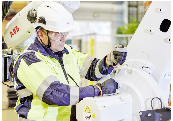
ABB Robotics bietet eine breite Palette von Servicelösungen an

Von folgenden ABB Robotics Dienstleistungspaketen können Sie profitieren: