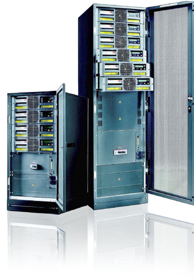
DPA UPScale ST 10 – 200 kW

Innovation, Qualität und Service: die Erfolgskombination für eine sichere, unterbrechungsfreie Stromversorgung. Die Entwicklung und Produktion von innovativen und qualitativ hochwertigen USV-Anlagen ist die eine Seite. Kundenzufriedenheit, Funktionalität und Kosteneffizienz im Alltagsbetrieb die andere. Dazu gehören Serviceleistungen wie die korrekte Bedarfsermittlung, Installation und Instandhaltung unserer Systeme.