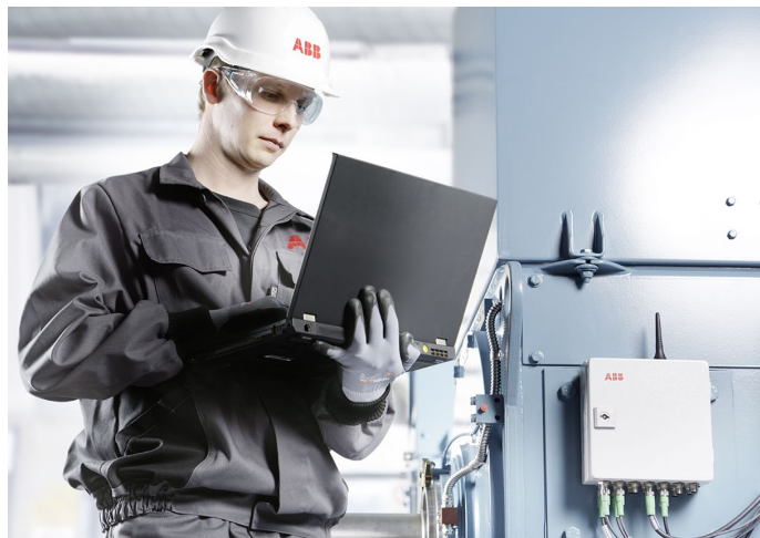
Surveillance continue à distance avec ABB MACHsense-R

La maintenance préventive de vos équipements électriques vous permet d'éviter les arrêts de production imprévus et coûteux ! Et en cas de panne, nous les éliminons directement sur place ou dans notre atelier. Le service à la clientèle d'ABB