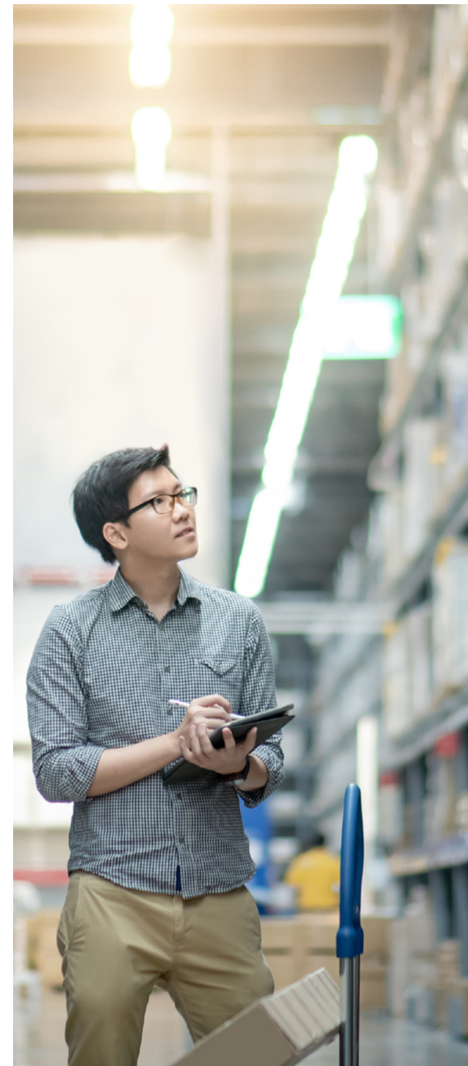
ABB 保留与贵方一起在贵方的次级供应商 (ABB 二级) 现场进行审核的权利。

我们希望贵方能够全面了解自己的供应链, 也称为供应链映射, 这样贵方就可以根据本《供应商行为准则》中涵盖的所有主题快速识别和降低风险。