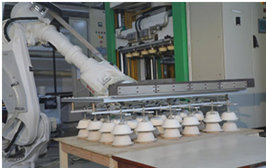
ABB och Zume påskyndar övergången från engångsplast

Med ABB:s robotar automatiseras produktionen och gör Zumes komposterbara förpackningar till ett kostnadseffektivt alternativ till engångsplast.