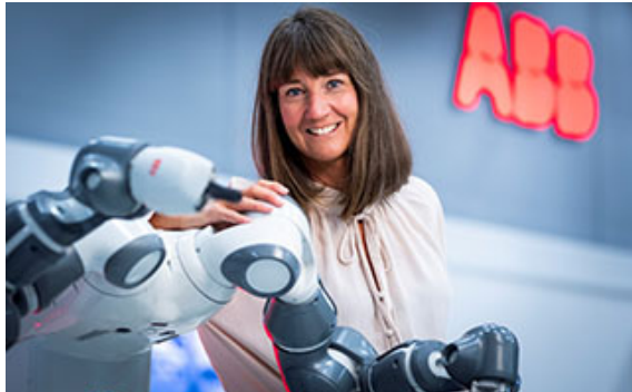
ABB vinnare av Sveriges Grönaste Varumärke 2022 i branschen Industri

För trettonde gången har det svenska folket fått säga sitt i undersökningen Sveriges Grönaste Varumärke.