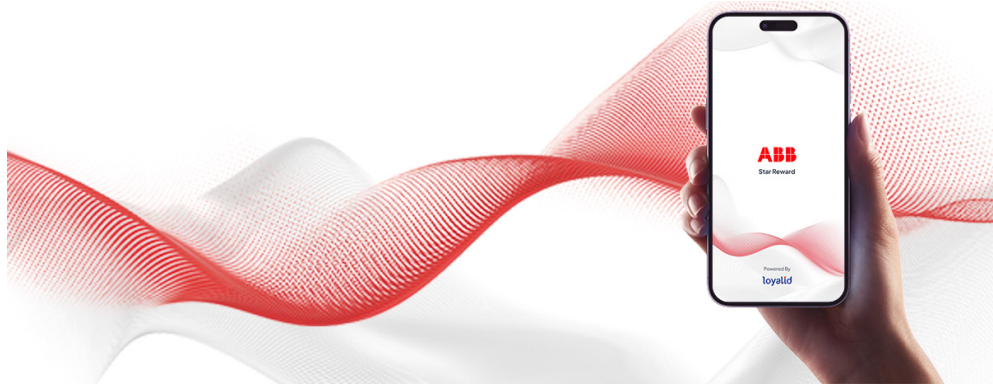
ABB Star Reward is a mobile application-based customer loyalty program that enables retailers to accumulate reward points from their purchases of ABB products made through ABB's authorized distributors. The accumulated points can be redeemed for various attractive rewards.

ABB Star Reward adalah program loyalitas pelanggan berbasis aplikasi seluler yang memungkinkan mitra ritel atau toko listrik, untuk mengumpulkan poin dari pembelian produk ABB melalui mitra distributor resmi ABB. Poin yang terkumpul dapat ditukarkan dengan beragam hadiah menarik.