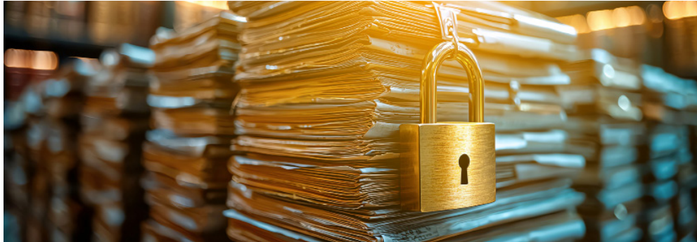
ABB and its service providers, which manages the platform, shall maintain strict confidentiality of all customer data, including the order value. ABB and service providers shall refrain from disclosing such confidential material to any third parties. Provided that ABB and service provider may disclose to government/state authorities where such disclosure is required by law or demanded by any state authority.

ABB will comply with the anti-trust and competition laws and shall maintain such safeguards in the loyalty program so that it does not have access to unit selling prices of distributor.