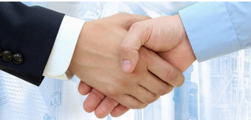
ABB Solution Trained Partner

El programa Solution Trained Partner (STP) tiene como objetivo contribuir en la formación especializada de los socios de ABB, transfiriendo el conocimiento y la experiencia en las soluciones y tecnologías de electrificación y digitalización de ABB.