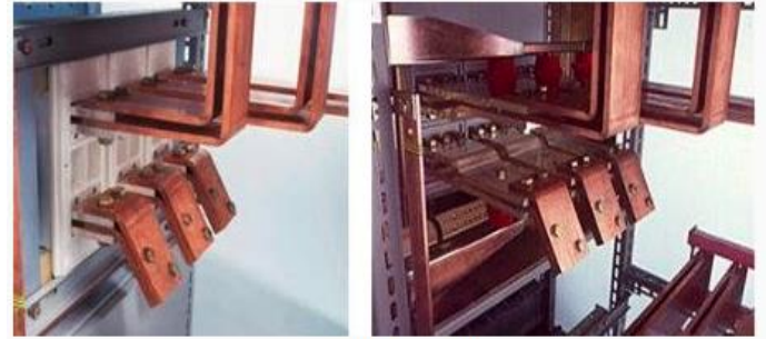
Antes vs Después

Los interruptores antiguos no proporcionan la fiabilidad y las garantías de seguridad requeridas en la actualidad. Asegurarse de que las personas, los equipos y los procesos estén debidamente protegidos es una preocupación creciente.