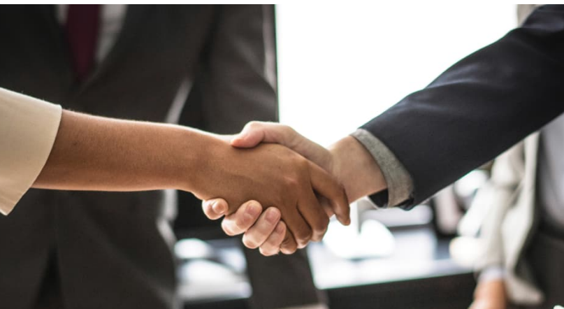
ABB Solution Trained Partner Segundo ciclo

El programa Solution Trained Partner (STP) tiene como objetivo contribuir en la formación especializada de los socios de ABB, transfiriendo el conocimiento y la experiencia en las soluciones y tecnologías de electrificación y digitalización de ABB.